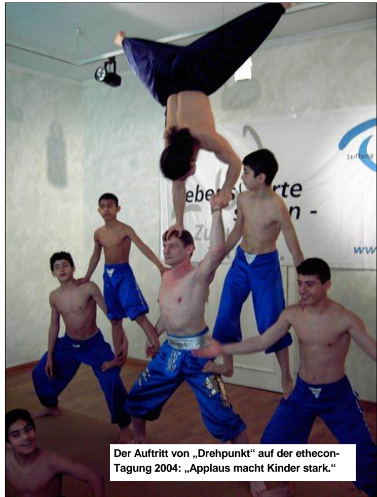
Der Auftritt von „Drehpunkt“ auf der ethecon-Tagung 2004: „Applaus macht Kinder stark.“

Mit Mitteln der Stiftung ethecon konnten notwendige Trainingsmittel und Kostüme angeschafft werden. Zudem fördert ethecon die Vernetzung mit gleich gesinnten Projekten und damit die Professionalisie-