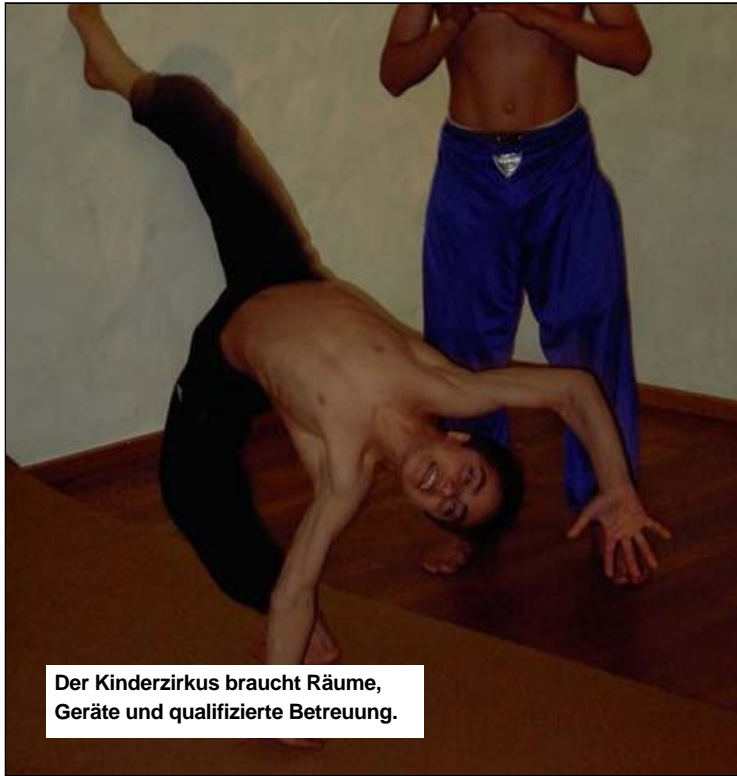
Der Kinderzirkus braucht Räume, Geräte und qualifizierte Betreuung.

Organisation von Auftritten und akrobatische Trainingsarbeit hinausgeht.