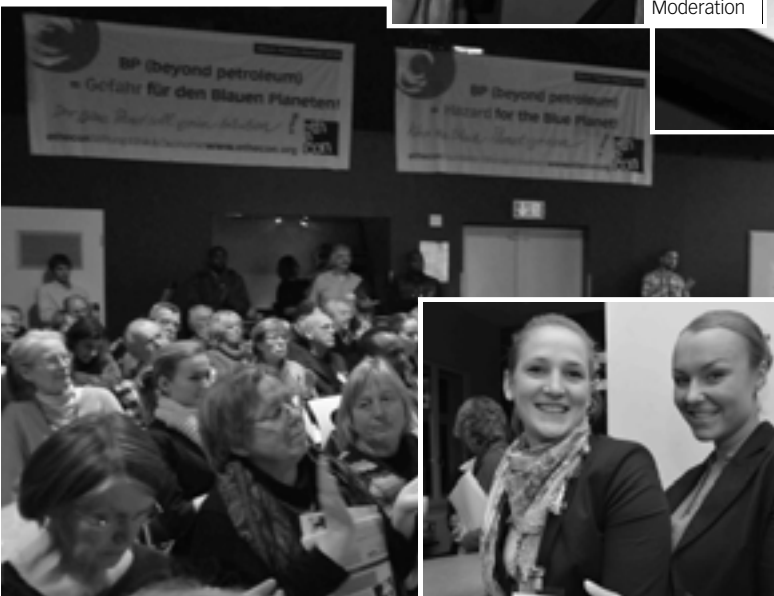
Das Publikum folgt mit großer Aufmerksamkeit