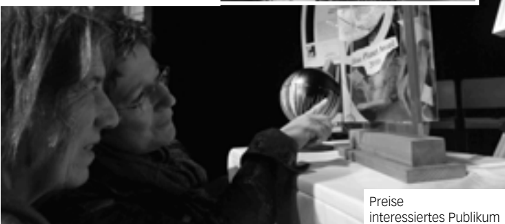
Preise interessiertes Publikum