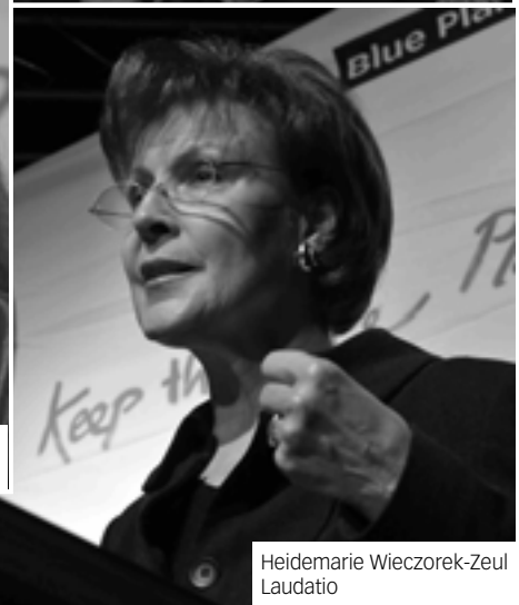
Heidemarie Wiczorek-Zeul Laudatio